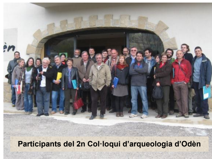
Participants del 2n Col·loqui d'arqueologia d'Odèn